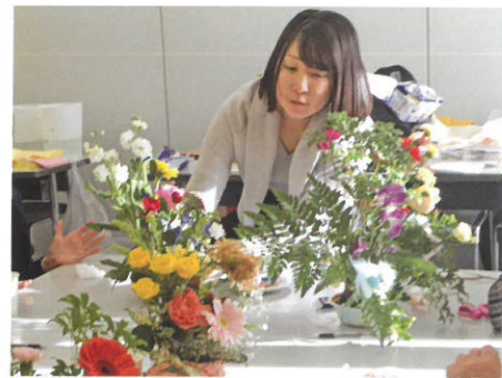
花*コミュニケーターに必要なスキル、生花の扱い方・老年学・心理学を総合的に学べます。