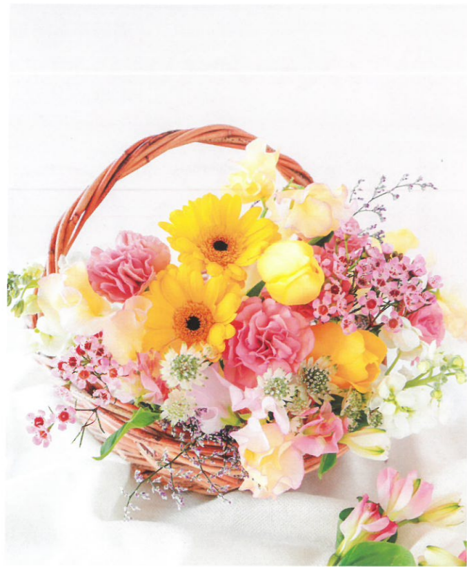
お花は心に潤いを与えてくれます。お花とのふれあいを通して、高齢者のフレイル予防に役立てたいと考えています。