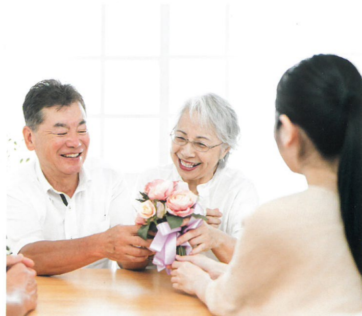
日本は超高齢社会に突入し、今後も高齢化は急速に進むとされ、高齢者が占める割合は、2025年には総人口の約30%、2060年には約40%に達すると予想されます。高齢者の「健康寿命」を延ばすことは、最重要課題です。